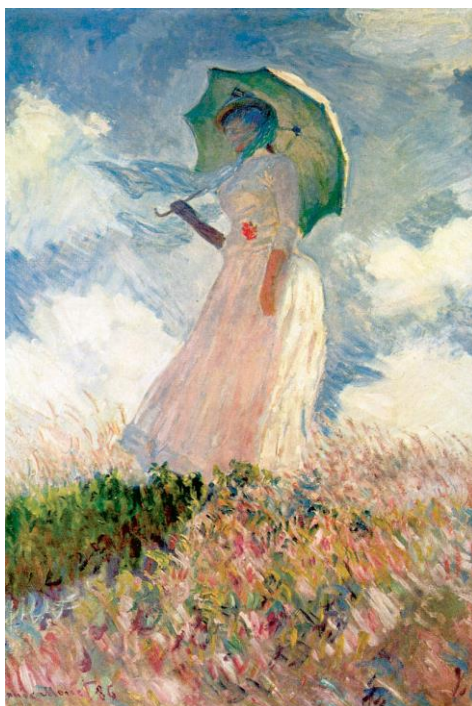
К. Моне. Прогулянка. Жінка з парасолькою. 1875 р.

Світ у творах імпресіоністів рухливий, мінливий і розмаїтий у своїх змінах. Людина, з погляду імпресіоністів, – органічна частина світу, вона не протиставлена йому, а живе з ним одним життям. Тому імпресіоністи «вписують» образи людей у свої пейзажі. Незалежно від того, де зображена людина – чи то в місті, чи то на лоні природи, людина не від’ємна від того світу, де живе.