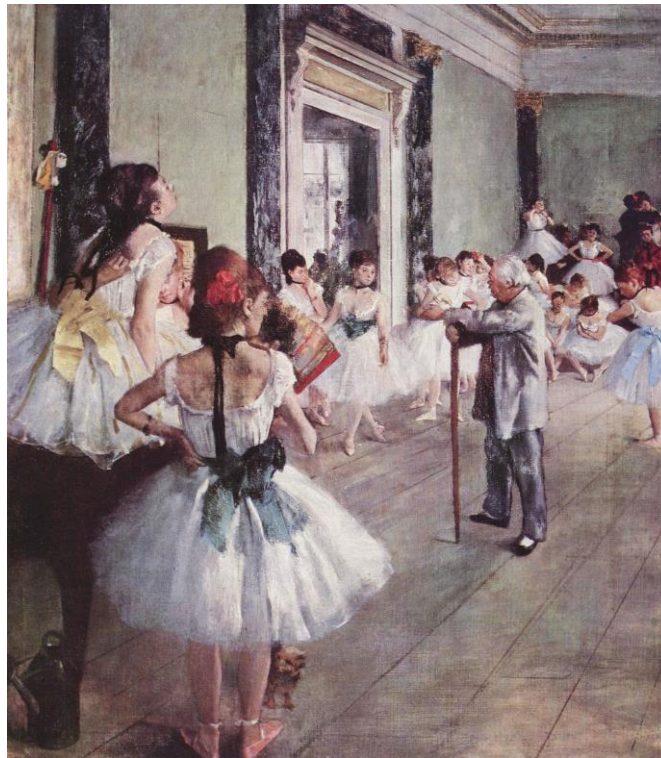
Е. Дега. Урок танців. 1875 р.

П'єр Огюст Ренуар приділяв велику увагу зображенню людського обличчя в його постійних змінах, що залежало від настроїв і почуттів. Оскільки емоційна сфера жінок та дітей дуже рухлива й складна, художник зробив їх головними героями своїх картин.