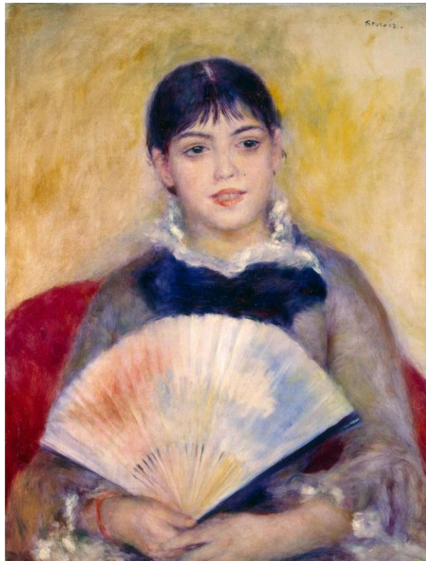
О. Ренуар. Дівчина з віялом. 1881 р.

П'єр Огюст Ренуар приділяв велику увагу зображенню людського обличчя в його постійних змінах, що залежало від настроїв і почуттів. Оскільки емоційна сфера жінок та дітей дуже рухлива й складна, художник зробив їх головними героями своїх картин.