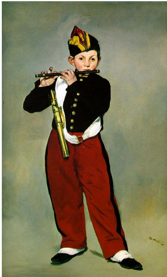
Е. Мане. Флейтист. 1866 р.

Едуард Мане стояв у витоків імпресіонізму в європейському живописі. Він винайшов нові прийоми мистецтва й намагався відтворити майже невловимі стани людини, зміни в духовному світі особистості й у природі, мінливі миттєвості життя людей та навколишньої дійсності.