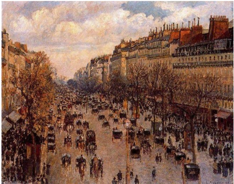
К. Пісарро. Бульвар Монмартр. Захід. 1897 р.

Імпресіоністи будували своє мистецтво на новітніх досягненнях теоретичної оптики, спираючись на праці Гельмгольца і Шеврейля. Трактують колір як окремих дрібних мазків фарб, що з певної відстані сприйняті оком; ліній як зіставлення по-різному зафарбованих (чи по-різному освітлених) поверхней; світлотіні як іншого вияву світла, як сполуки й боротьби світлових променей різної сили – усі ці принципи імпресіоністичного живопису пов'язані з тогочасною теоретичною оптикою. Імпресіоністи зрозуміли, що домінуючу роль відіграє не колір, а світло, всі кольори здатні до взаємопроникнення і є різними проявами світла (світлового променя), а звідси – зникають межі між різними кольорами й предметами. Отже, колористичний світ набуває єдності.