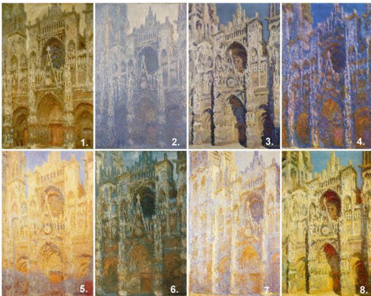
К. Моне. Руанський собор. 1894 р.

Митці прагнули відтворити неповторність миттєвостей. Дуже часто імпресіоністи любили малювати один і той самий об'єкт, але в різні часи дня, при різному освітленні, за різних умов. Це давало можливість показати, як міняється світ і враження про нього. Так, у 1894 р. Клод Моне кілька разів малює Руанський собор – вранці, опівдні, увечері. Це різні картини, і головну роль в них відіграє не предмет зображення, а його освітлення.